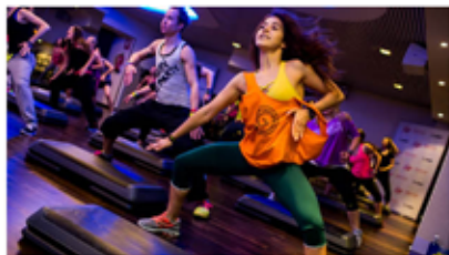
Ilustračné foto: ZUMBA FITNESS

CVIČENIA: latino tanec, zumba fitness, bojové umenia a sebaobrana, folklórny súbor Úvrat', ČCHI KUNG - práca s energiou