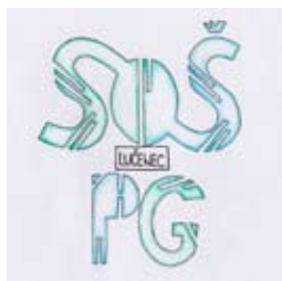
N. Balážová, III.C