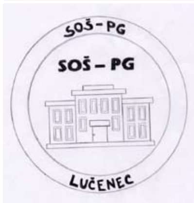
Silvia Vanzalová, III.B