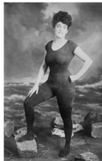
Annette Kellerman pózuje v šatách, za ktoré bola neskôr zatknutá kvôli verejnému pohoršovaniu

Nielen muži veľkou mierou zasahovali do chodu dejín, ale boli medzi nimi aj udatné ženy. O tých sa na hodinách dejepisu veľmi veľa nehovorí, čo je veľká škoda. Bojovali za slobodu svojej krajiny hlavne svojou odvahou a silou. Tieto historické fotky ťa o tom presvedčia.