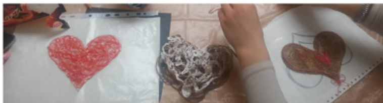
Kaširované srdiečka: študenti, III.B