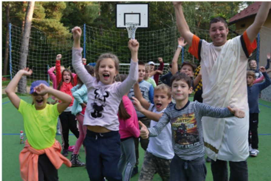
Môj šikovný tím detí počas olympiády...

Streda – teda tretí deň - sa niesol v znamení rozprávky Judy Hopkovej – ZOOTROPOLIS. Ako sme zistili, deti túto rozprávku dokonale poznali, jej dej im nerobil absolútne žiadny problém. Popoludní každý animátor so svojim oddielom vyrazil na „okružnú túru po Duchonke – cez hory, cez doly, cez ten les...“. Dopoludnia sme my, animátori, rozmiestnili v lese a prírode rôzne indicie a vyznačili pre deti trasu. Na indiciách boli kľúčové slová z rozprávky od Judy Hopkovej a o celom deji. Okrem indícií sa na trase nachádzali aj tzv. „pascé“ – úlohy pre deti, ktoré museli priamo na trase splniť. Deti si museli okrem plnenia úloh zapisovať nájdené slová a indicie a po návrate na hotel za pomoci animátora zostaviť scénu – netriviálny dej tejto rozprávky podľa nich. Popri tvorení deti stihli aj olovrant a oddych pred večerou. Po skvelej večeri sa všetky tímy pustili do predvádzania tých najlepších hereckých výkonov. Môžem povedať, že scény boli ozaj úsmevné a detská fantázia nemá hraníc. Po týchto skvelých výkonoch sme deťom dopriali super večernú diskotéku, aby si vychutnali aj odmenu za dnešné vynaložené úsilie.