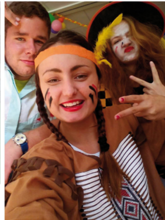
Náš skvelý animačný tím